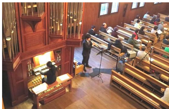
クリスマス・オルガンコンサートにて