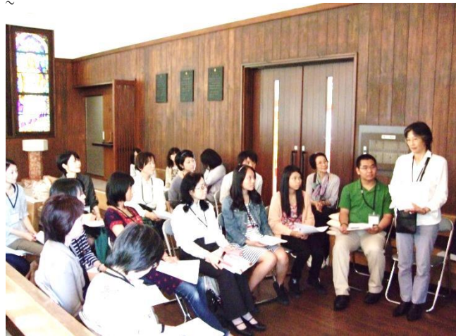
レッスンを受ける皆さん